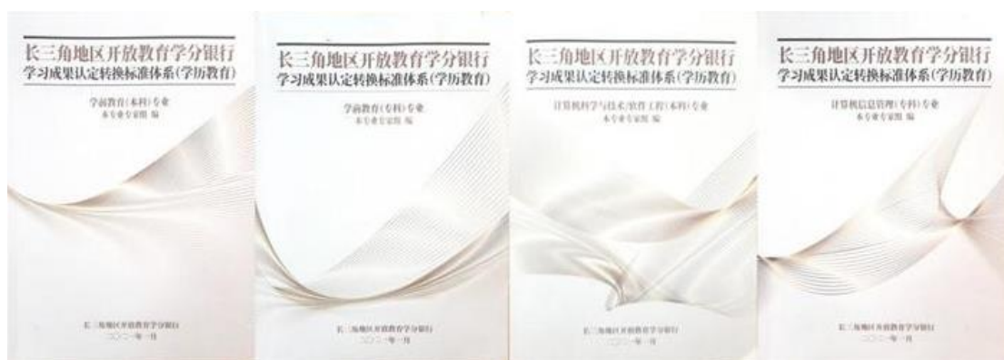
图 5：参与长三角地区相关专业标准体系研发成果

推动“互联网+”农民工继续教育工程。为农民工学员提供一张实现知识平等、推开大学之门的“门票”，全力补齐教育发展的短板。依托园区平台，助力求学圆梦，围绕提升农民工技能与综合素养，为培养新时代产业工人提供智慧服务。目前，省内已有 26 所具有特色的本专科高校专项招生农民工群体，涉及农学、电子商务等 20 多个专业，累计招收各类农民工近 2 万余人。