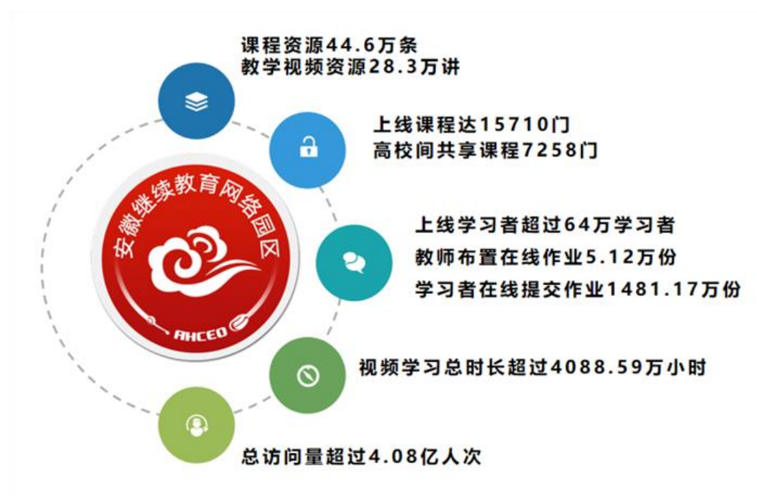
图 2：园区平台基础数据

实现资源共建共享。园区以形式多样的方式方法实现教育资源共建共享，为高等继续教育高质量发展提供更加优质的资源保障。联合合肥工业大学、亳州职业技术学院等本专科高校，共建“艺术设计”“中药学”等4个专业50门课程网络资源；丰富园区课程超市311门课程，打造“高职教学示范区”“中职教学示范区”，涵盖护理等14个专业89门课程；联合国家数字化学习资源中心，推出疫情防控微视频60余讲。2021年起，园区课程超市中成考辅导系列课程全部免费向社会学习者开放，涉及本专科共7门课程，选学人数超过1万人次，课程超市累计学习人数达6.92万人次。