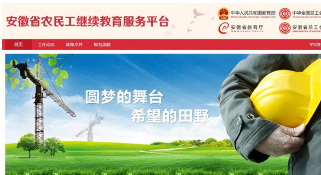
图 6：安徽省农民工继续教育服务平台

推动“互联网+”农民工继续教育工程。为农民工学员提供一张实现知识平等、推开大学之门的“门票”，全力补齐教育发展的短板。依托园区平台，助力求学圆梦，围绕提升农民工技能与综合素养，为培养新时代产业工人提供智慧服务。目前，省内已有 26 所具有特色的本专科高校专项招生农民工群体，涉及农学、电子商务等 20 多个专业，累计招收各类农民工近 2 万余人。