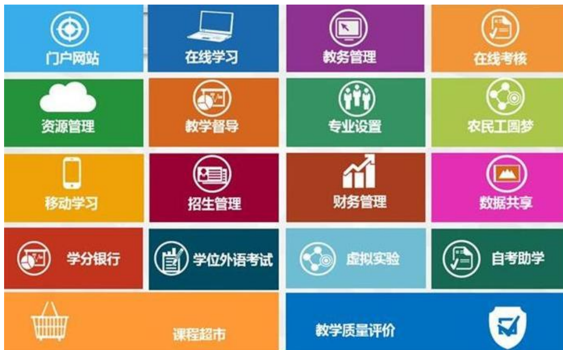
图 1：园区平台十八大子系统

搭建综合性智慧平台。为满足教育主管部门、高校和学习者的需求，园区采用大数据等信息化技术，完成安徽继续教育在线平台中在线教学等 18 个互联互通子系统项目建设，为高等继续教育高质量发展提供稳固根基。以政府引领、高校联动、资源共享、规范有序、虚实转换的新机制为基底，逐步形成了基于网络的、有支持的、自主学习的、线上与线下教学支持服务融合发展的继续教育教学 OMO 新模式，真正实现“一体化教学、一站式学习、智能化管理、全过程服务”功能，推动了“高校多种继续教育形式的融合发展”。省内近百余所高校及教育机构依托园区开展远程化教学模式改革，超过 64 万学习者在园区平台学习，园区平台总访问量超过 4.08 亿。