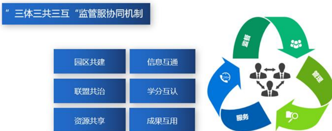
图 4：“三体三共三互”高等继续教育高质量发展新生态